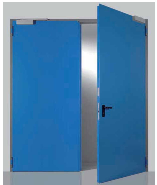
Porta a due ante