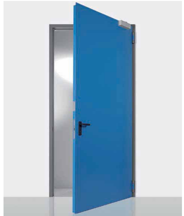
Porta ad un'anta